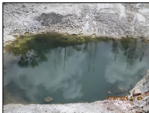
ภาพที่ 2.21 บ่อกักเก็บน้ำ (sump)