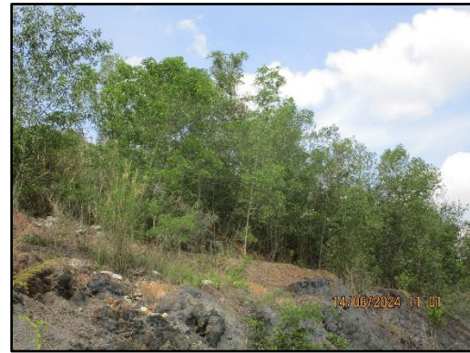
ภาพที่ 2.14 สภาพป่าที่เว้นจากการทำเหมือง