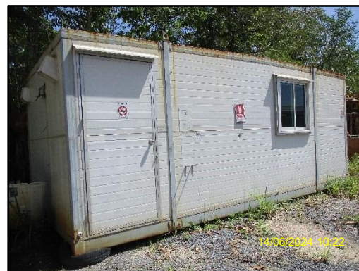
ภาพที่ 2.25 สถานที่พักพนักงานในบริเวณพื้นที่โครงการ