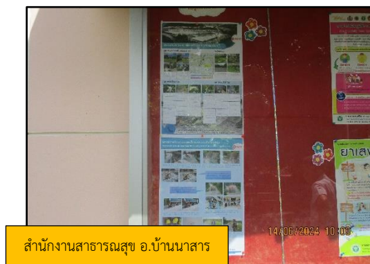
ภาพที่ 2.10 การแสดงผลการติดตามตรวจสอบผลกระทบสิ่งแวดล้อม ณ พื้นที่โครงการ และแหล่งชุมชนในพื้นที่โครงการตั้งอยู่