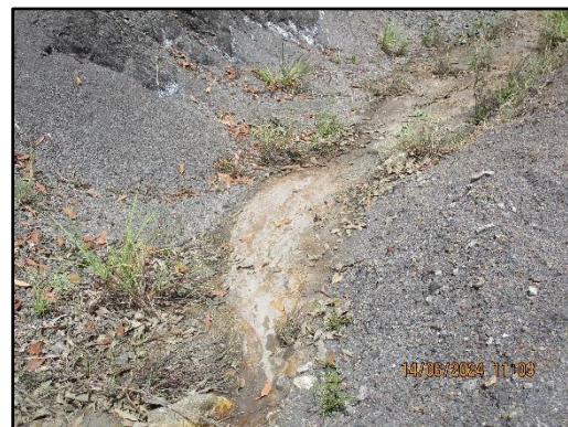
ภาพที่ 2.3 คูระบายน้ำรอบพื้นที่โครงการ