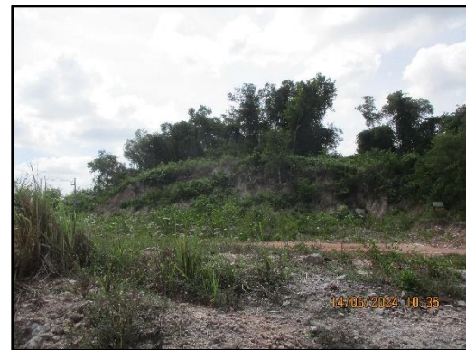
ภาพที่ 2.15 พื้นที่เก็บกองเปลือกดิน