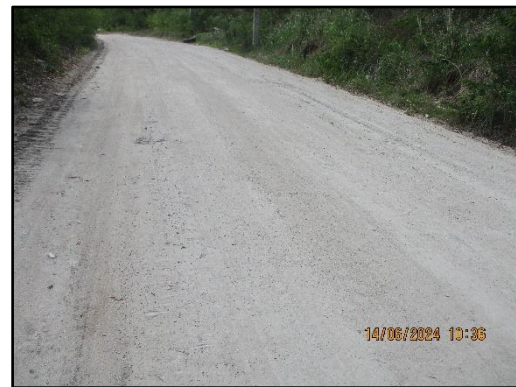
ภาพที่ 2.6 สภาพเส้นทางลำเลียงแร่ที่ปรับแต่งผิวถนนและบดอัดแน่น