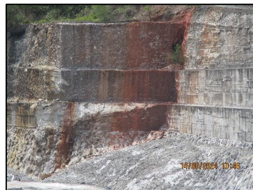
ภาพที่ 2.22 เปิดหน้าเหมืองแบบขั้นบันได