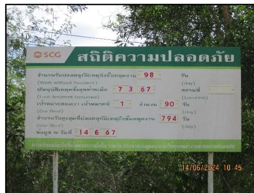
ภาพที่ 2.24 ป้ายแสดงสถิติความปลอดภัย