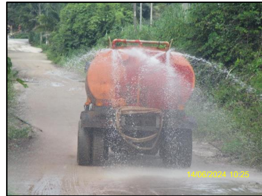
ภาพที่ 2.17 รถฉีดพรมน้ำบริเวณหน้าเหมืองและบริเวณเส้นทางขนแร่