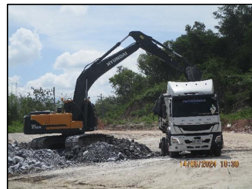
ภาพที่ 2.18 การตักแร่ใส่รถบรรทุก