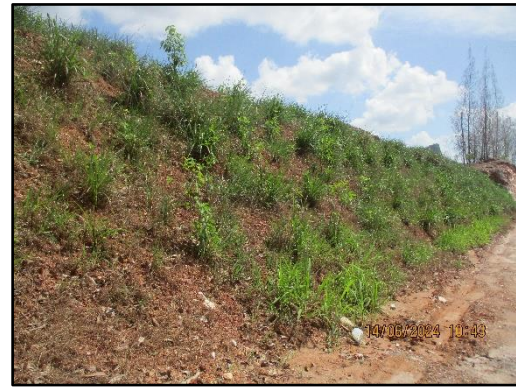
ภาพที่ 2.5 การปลูกไม้ยืนต้นบริเวณแนวคันนบดิน