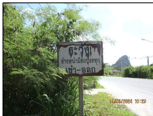
ภาพที่ 2.9 ป้ายสัญญาณจราจร บริเวณช่วงเลี้ยวก่อนเข้า-ออกจากพื้นที่โครงการ