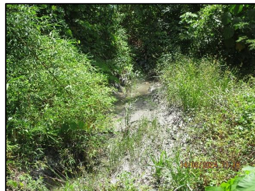
ภาพที่ 2.4 บ่อดักตะกอนในพื้นที่โครงการ