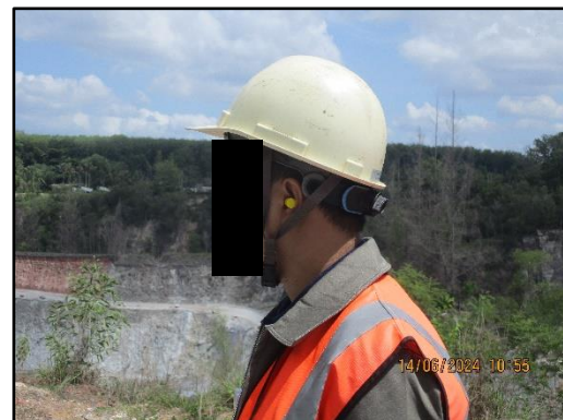
ภาพที่ 2.12 พนักงานสวมใส่อุปกรณ์ป้องกันอันตรายส่วนบุคคล