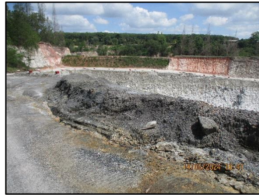
ภาพที่ 2.2 คันทำนบดินรอบพื้นที่โครงการ