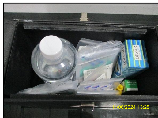
ภาพที่ 2.13 อุปกรณ์ปฐมพยาบาลเบื้องต้น