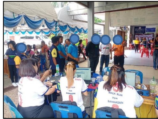
ภาพที่ 2.23 กิจกรรมชุมชนสัมพันธ์