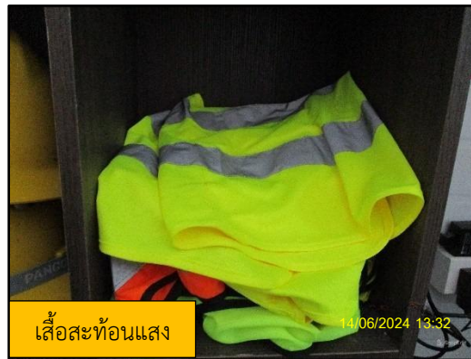
ภาพที่ 2.11 ตัวอย่างอุปกรณ์ป้องกันอันตรายส่วนบุคคล