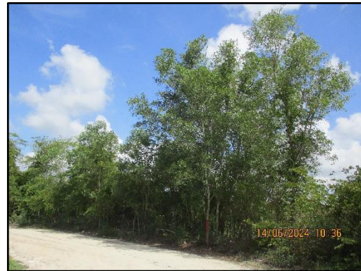
ภาพที่ 2.20 สภาพต้นไม้บริเวณริมเส้นทางขนส่งแร่