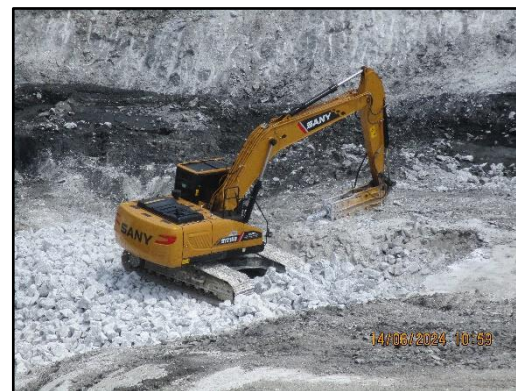
ภาพที่ 2.16 การใช้เครื่องจักร Surface Miner มาใช้ในการทำเหมือง