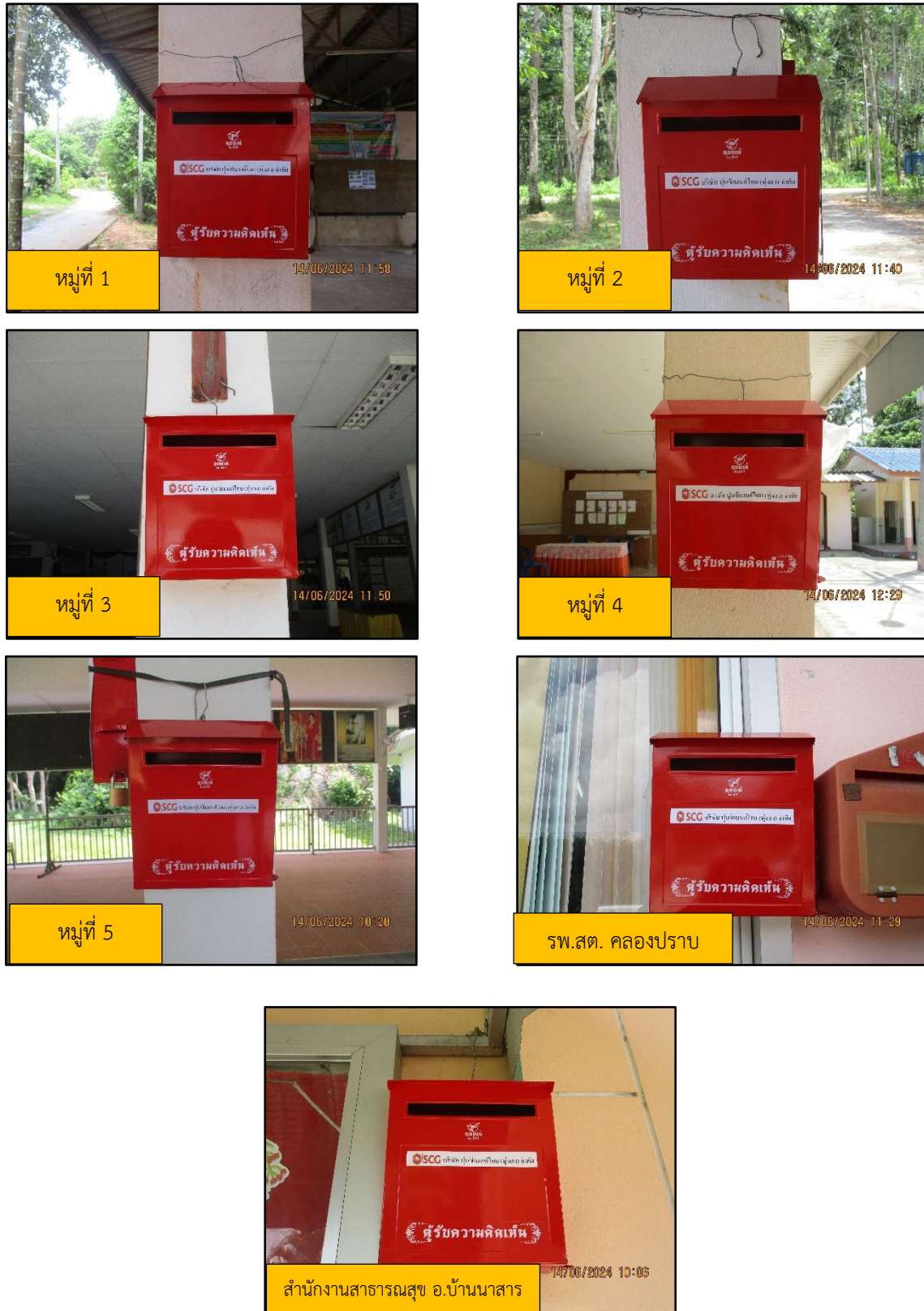
ภาพที่ 2.1 จุดรับเรื่องร้องเรียนบริเวณต่างๆในชุมชน